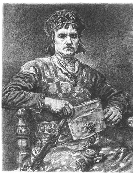
Bolesław V Wstydlivy (Cnotliwy, Roztropny)